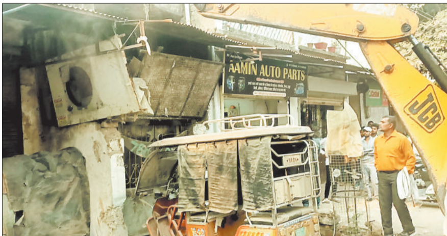
दुकानों के सामने से अतिक्रमण हटाता नगर निगम का अमला।

शहर में आवागमन बाधित होने और लगातार लगे रहे जाम से राहत दिलाने के लिए नगर निगम और ट्रैफिक पुलिस ने एक बार फिर संयुक्त अभियान चलाया। अभियान के दौरान सड़क किनारे दुकानों के सामने किए गए अतिक्रमण को बुलडोजर से हटाया गया। साथ ही अवैध कब्जा करने वाले व्यापारियों पर भी कार्रवाई की गई। ध्यान रहे कि शहर के अग्रसेन चौक से पुराना बस स्टैंड, श्रीकांत वर्मा मार्ग और महाराणा प्रताप चौक से नेहरू चौक तक के क्षेत्रों को पहले ही ट्रैफिक वायलेशन फ्री ज़ोन घोषित किया जा चुका है। इन इलाकों में यातायात नियमों का उल्लंघन करने वालों पर बिना