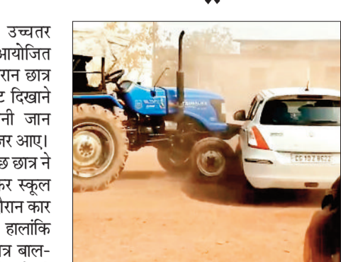
के सम्मान में विदाई पार्टी का आयोजन किया गया। इस दौरान दो छात्र ट्रैक्टर और कार ड्राइव