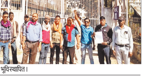
प्रदर्शन करते भूविस्थापित।

हरिभूमि न्यूज़ ►► कोरबा एसईसीएल कुसमुंडा खदान से प्रभावित ग्राम जरहाजेल के भूविस्थापितों ने अधिग्रहित जमीन किसानों को वापस करने व पेड़ों की कटाई पर तत्काल रोक लगाने की मांग को लेकर कलेक्टर को ज्ञापन सौंपा है। भूविस्थापितों का आरोप है कि कुसमुंडा प्रबंधन व जिला प्रशासन द्वारा ग्राम जरहाजेल में अन्य ग्रामों की पुनर्वास के लिए बुलडोजर चलाकर पेड़ों की कटाई की जा रही है। जबकि जमीन अर्जन के लिए वर्ष 1983 में पारित अवाई में स्पष्ट रूप से 20 वर्ष बाद भूख खतरेतों को जमीन वापस करने की शर्त रखी गई थी। इसके