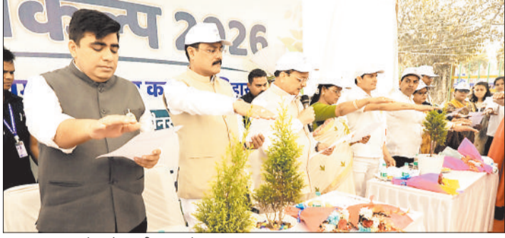
शपथ ग्रहण करते उद्योग मंत्री एवं कलेक्टर।