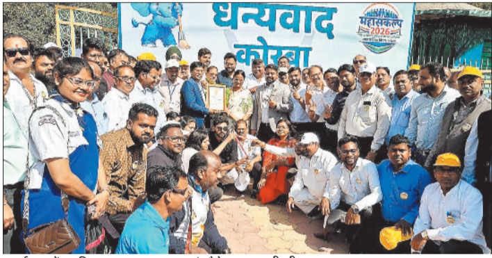
कार्यक्रम में उपस्थित आमजनमानस एवं मौके पर उमड़ी भीड़।