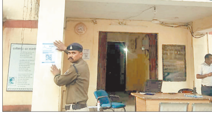
आरक्षक थाने में चस्पा करता क्यूआर कोड।