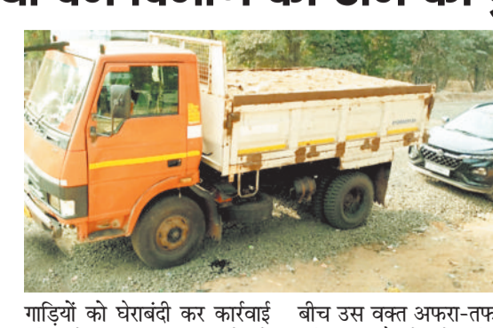
गाड़ियों को घेराबंदी कर कार्रवाई की, लेकिन तस्कर भागने में कामयाब रहे। जिले के अमरकंटक बॉर्डर क्षेत्र की शांत पहाड़ियों के

जिले में वन विभाग के कर्मचारियों ने फिल्मी अंदाज में 6 किलोमीटर पीछा कर अवैध रेत से भरी गाड़ी को पकड़ी है। 3 फरवरी को जुआटोला से गौरला की तरफ एक ट्रक आ रहा था, जिसमें अवैध रेत लदी थी। रेत माफिया कार प्तार था। वन विभाग की टीम पर मध्यप्रदेश के रेत माफिया ने हमले की कोशिश की। उन्होंने कार्रवाई में शामिल कर्मचारियों को कुचलने का प्रयास किया। टीम ने रेत से लदी