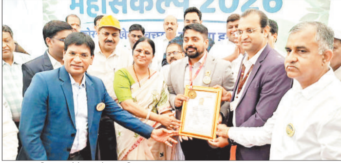
प्रशस्ति पत्र लेते महापौर एवं निगम आयुक्त।